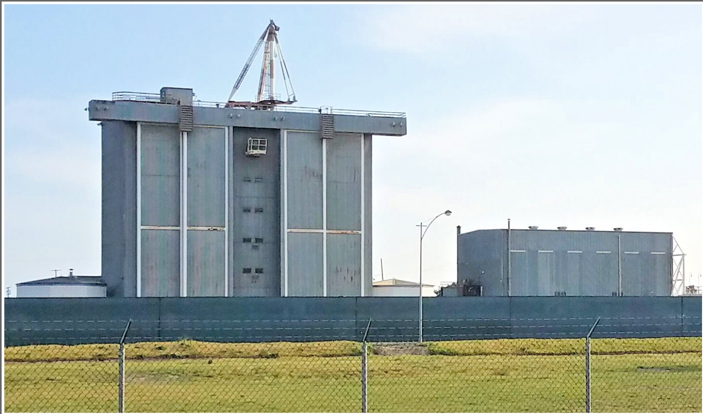
Cao Ốc Ráp Nối Hỏa Tiễn Saturn, Seal Beach, 2018.