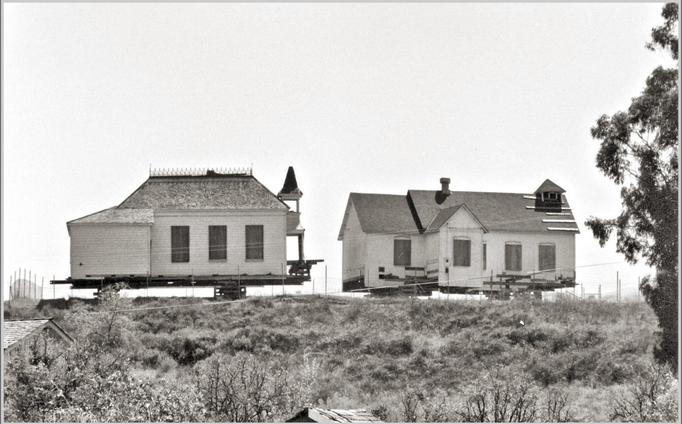
Nhà thờ cổ và trường học lịch sử được chuẩn bị di chuyển từ trung tâm El Toro cũ đến Công Viên Heritage Hill Historic Park ở Lake Forest, 1978