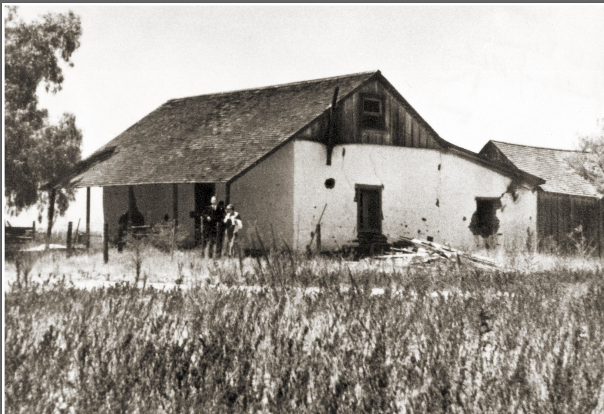
大約1930年的塞拉諾莊園（Serrano Adobe），位於艾爾托羅，即湖森林市（Lake Forest）。