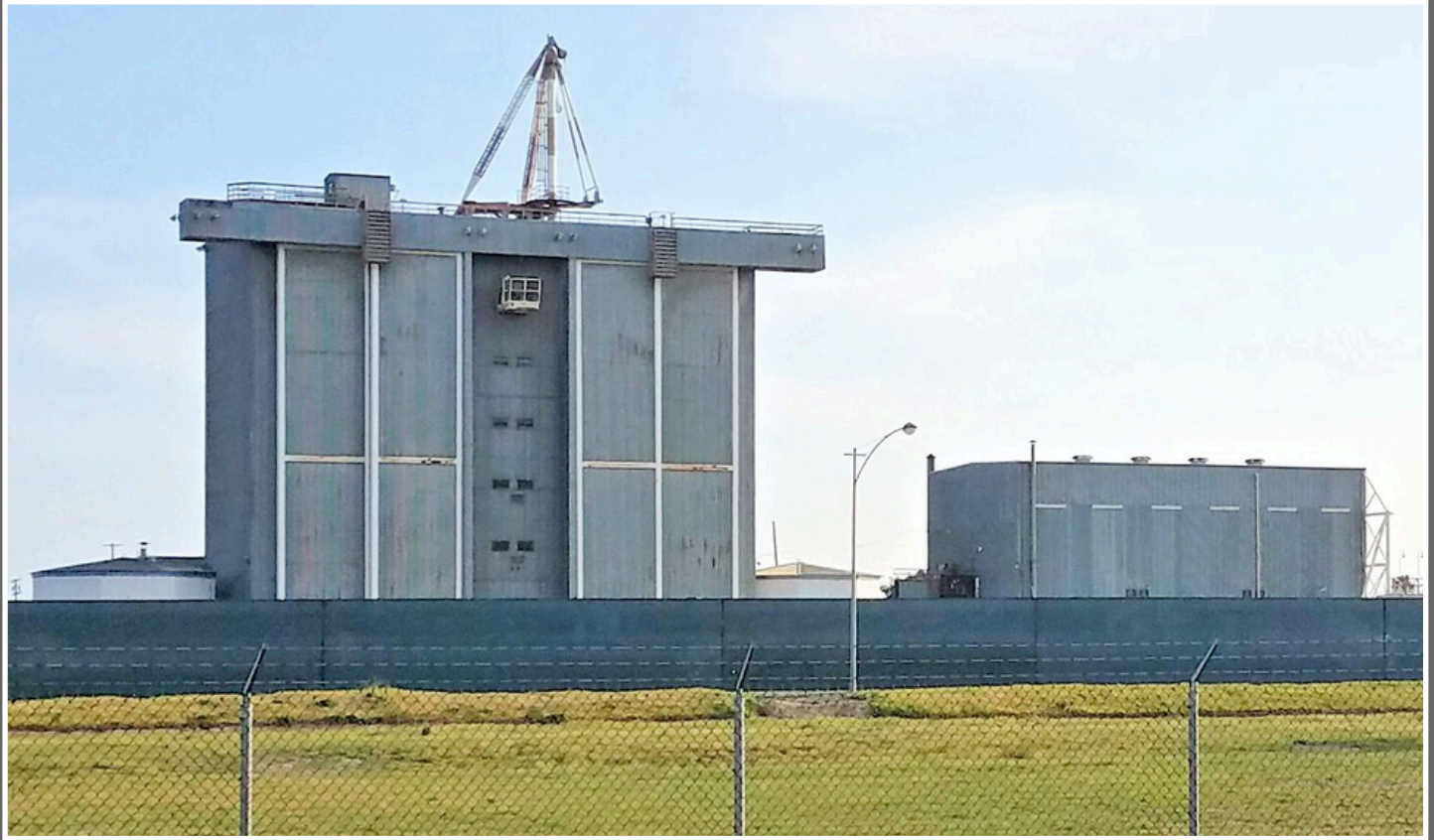
Edificio de montaje del cohete Saturno, Seal Beach, 2018.