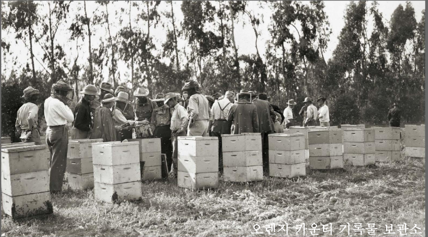
오렌지 카운티 기록물 보관소

양봉가들의 양봉 사업은 1860년대 초부터 오렌지 카운티 농업 경제의 핵심으로 자리잡았습니다. 1946년에 촬영한 이 사진에서, 지역 농부들은 오렌지 카운티 농업 개발부에서 주최한 양봉장 관리 강좌에 참석하고 있습니다.